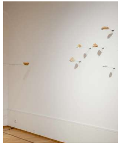
Gregorio Botta Sisifo