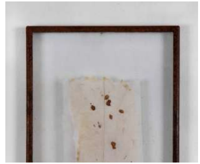
Gregorio Botta Esercizio di deposizione I Carta di riso, grafite, sangue, vetro, ferro 35x24x3 2018