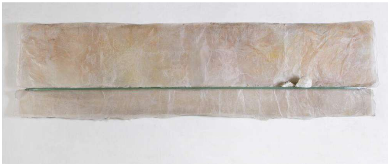
Gregorio Botta, La natura usa il giallo più di rado, 2022, carta di riso, pigmenti, cera, vetro, elementi naturali, 45x180x5 cm

Finale d'anno all'insegna dell'arte con i palinsesti delle nostre gallerie d'arte moderna e contemporanea ricchi di spunti e suggestioni per approfondimenti e (ri)scoperte. (...)