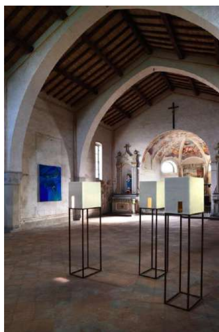
Quadri come luoghi, 2023. Installation view, Gregorio Botta, Alessandro Fogo. Chiesa di San Fermo (Calcio, BG).

«Fate vostri i nostri luoghi», è la premessa sottoscritta e condivisa dai Sindaci dei comuni che ospitano Quadri come luoghi , la mostra curata da Davide Ferri e Barbara Meneghel – nell'ambito di Bergamo Brescia capitale della cultura 2023 – in cinque luoghi, privati e poco frequentati, separati da un fiume ma collegati dai ponti: la Chiesa di San Fermo (Calcio, BG), Palazzo Adorni (Capriolo, BS), Cascina Castelletto (Mornico al Serio, BG), Villa Presti (Ospitaletto, BS) e Palazzo Oldofredi Tadini Botti (Torre Pallavicina, BG). Non si tratta di spazi espositivi, lo sono diventati in quest'occasione: sono connotati, diversi l'uno dall'altro e pieni di fascino e di storia. (...)