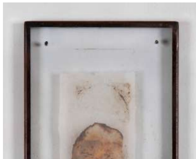
Gregorio Botta Esercizio di deposizione II Carta di riso, grafite, pigmenti, vetro, ferro 35x24x3 2018