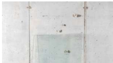
Gregorio Botta Sebastian 180x90x60 Vetro, ottone, terracotta 2022 Sisifo 180x170 ferro, vetro, cera, elementi naturali 2017