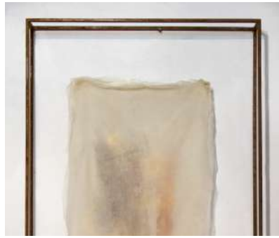
Gregorio Botta Velario 100x70X10 Garza di lino, pigmenti, elementi naturali 2023